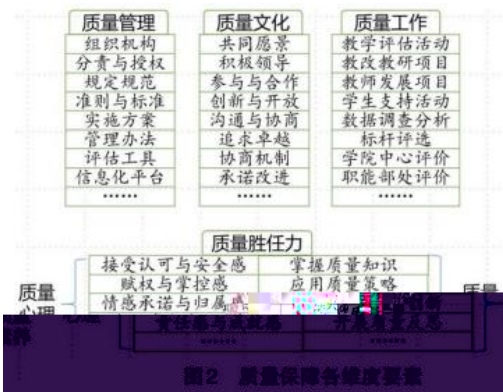
图2 质量保障各维度要素